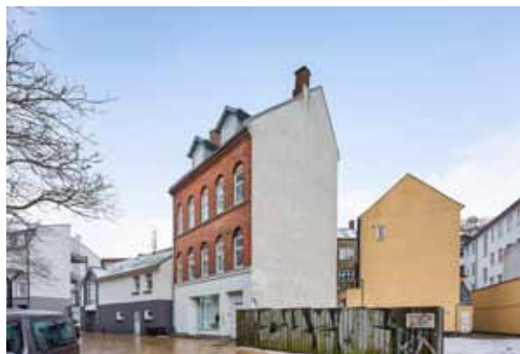
Ejendommen set fra Stålstræde/gården.