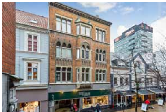
Ejendommen set fra gågaden.

Lejemålet med ‘Tante Grøn’ kan i forbindelse med etablering af letbanen, og et nyt flow gennem Odense gågade, højst sandsynlig lejes ud til en væsentlig højere husleje. De øvrige lejemål i den bedre ende af gågaden udlejes i øjeblikket til 6.300 kr. pr. kvm. Ved en renovering af lokalerne forventes det, at lejeniveauet vil komme op på dette niveau – i hvert tilfælde for en del af lokalerne. Alle boliglejemålene er relativt nyetablerede fra erhvervslejemål (kontorer). Det betyder, at der er ”helt fri husleje” for disse lejemål – og de kan altså lejes ud til det niveau, som der vil være lejere til. De bedst placerede boliglejemål i Odense udlejes nu til 1.050 - 1.200 kr. pr. kvm. Ved fraflytninger vurderes det, at der også vil være et leje potentiale i disse lejemål.