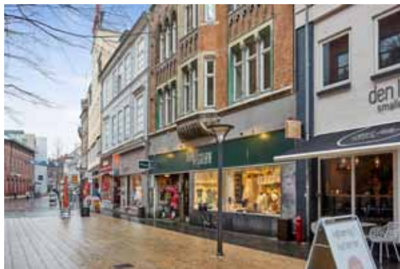
Ejendommen set fra gågaden.