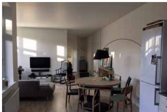
Interiør fra lejlighed